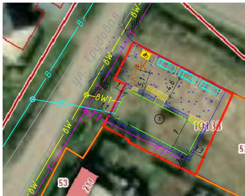
Схема планировочной организации земельного участка М 1:500